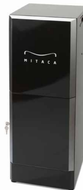
MOBILE IN METALLO MITACA Optional: frigorifero